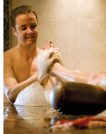
basenfasten - die wacker-methode

* nicht kombinierbar mit anderen Rabattaktionen